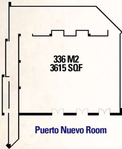
Puerto Nuevo Room